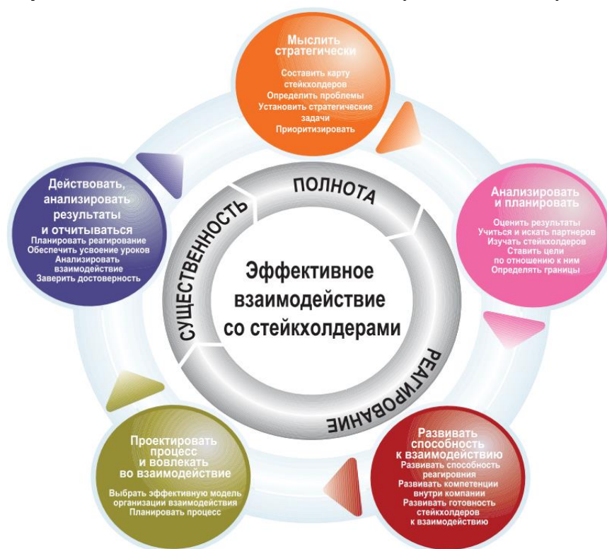
Рисунок 1. Развитие взаимодействия с заинтересованными сторонами